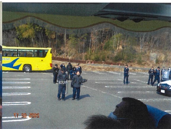
令和7年2月17日 バスジャック想定訓練