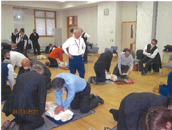
令和7年2月16日 応急救護