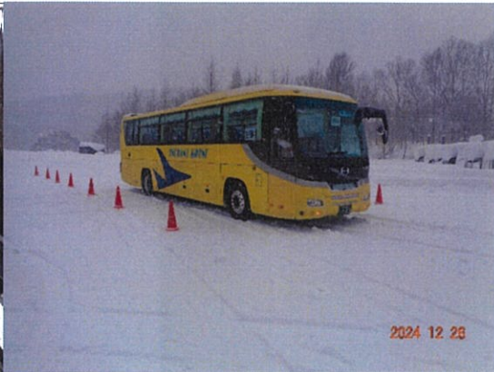
令和6年12月26日 雪道訓練