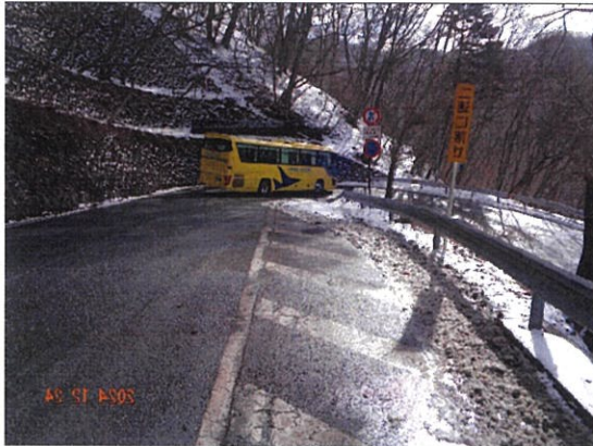
令和6年12月24日 坂道訓練