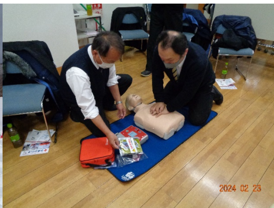
令和6年2月23日 応急救護