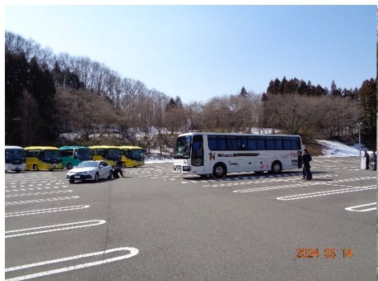
令和6年3月14日 バスジャック訓練