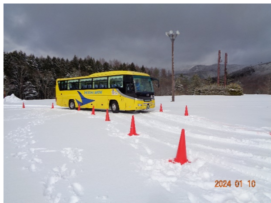
令和6年1月10日 冬道訓練